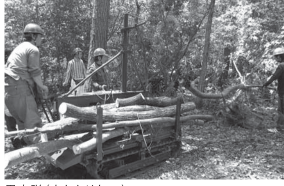
里守隊(さともりたい)

【お問い合わせ先】 NPO法人愛のまちエコ倶楽部(担当:平尾) 〒527-0162 東近江市妹町70「あいうエコプラザ菜の花館」 電話 0749-46-8100 / 電子メール support2@ai-eco.com Webサイト http://ai-eco.com/